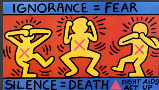
Keith Haring. Ignorance=Fear , 1989.