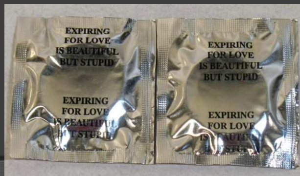
Jenny Holzer. Untitled (Expiring for Love is Beautiful but Stupid) , 1983-85.

-Los casos reportados en distintas poblaciones hacen que los investigadores sospechen que la transmisión del virus podía ocurrir a través del contacto con la sangre o de las relaciones sexuales.