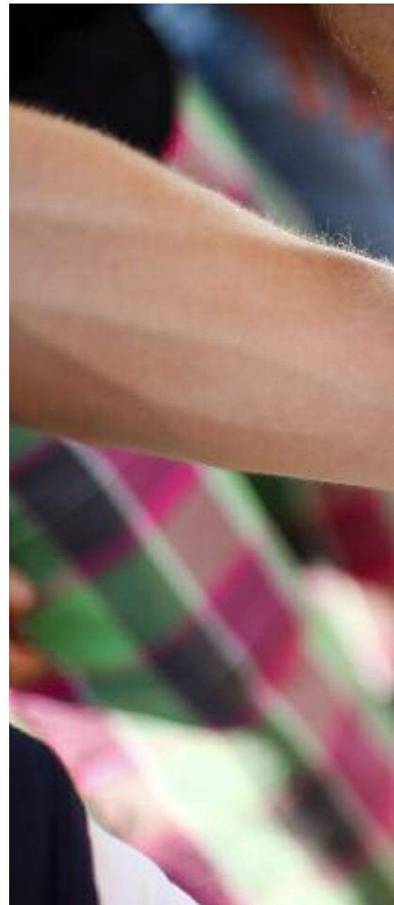
Pareja gay de la mano durante la Marcha del Orgullo que se celebra anualmente en Roma (Italia), junio de 2013.

En diciembre de 2011, cuando salió de una discoteca, la agredieron y le hizo insinuaciones sexuales. Cuando se negó, la agredieron otros hombres que la agredieron. Me dieron golpes atadas con todas artes.