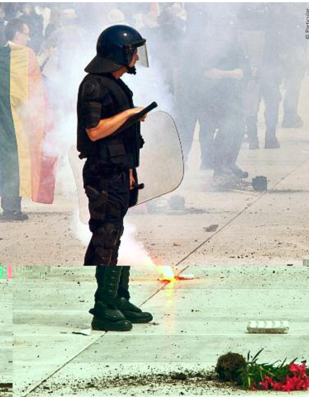
Imagen tras los actos del Orgullo en Split (Croacia) en 2011, que tuvieron que interrumpirse cuando unos contramanifestantes arrojaron proyectiles contra los activistas.

interferir en la capacidad de la policía o de otras autoridades para abordarlos eficazmente.