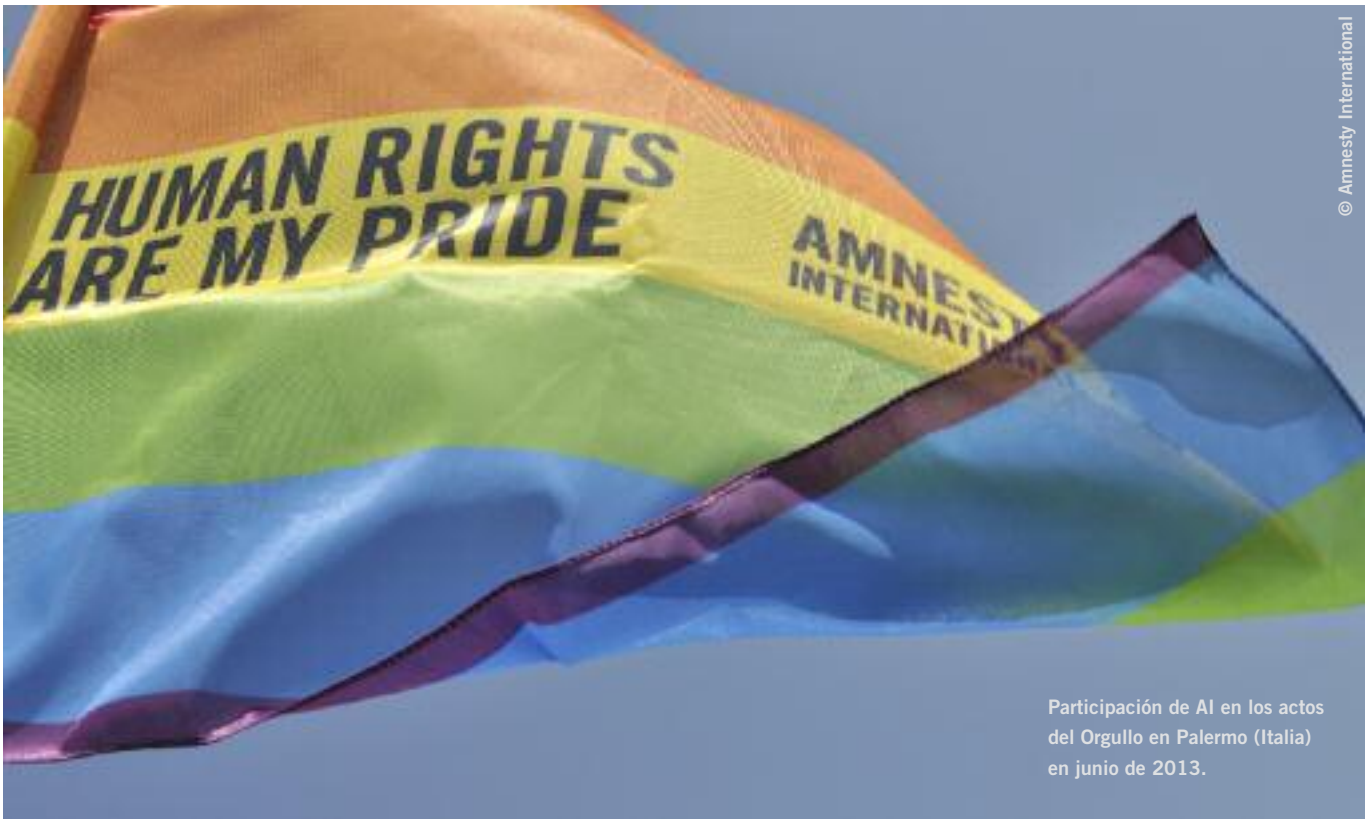
Participación de AI en los actos del Orgullo en Palermo (Italia) en junio de 2013.