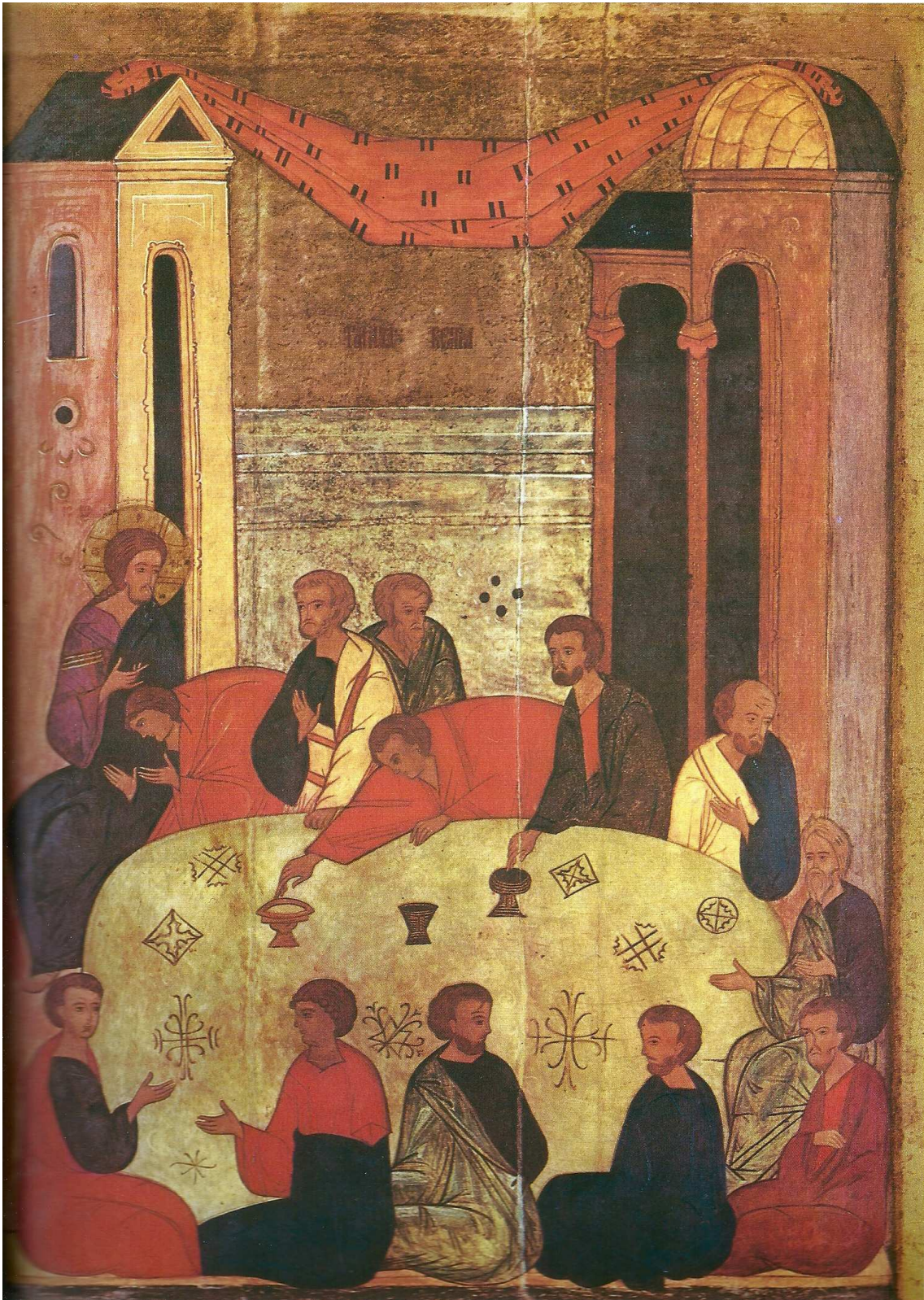
Misterio de Jesús: Icono número 11 (Última cena).