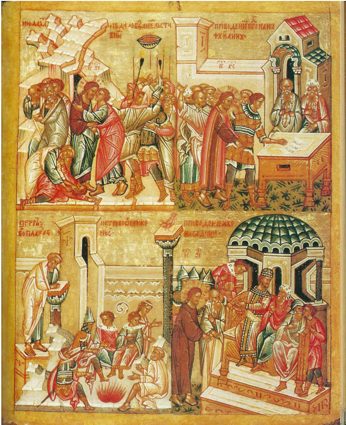
Misterio de Jesús: Icono número 12 (Prendimiento, negacion de Pedro, Juicios).