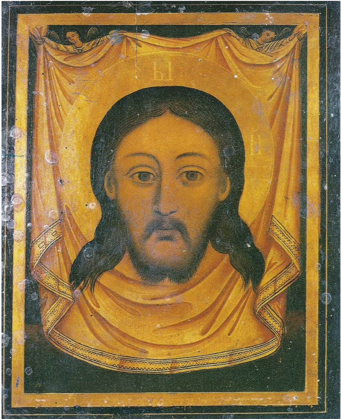
Misterio de Jesús: Icono número 14 (Santa Faz).