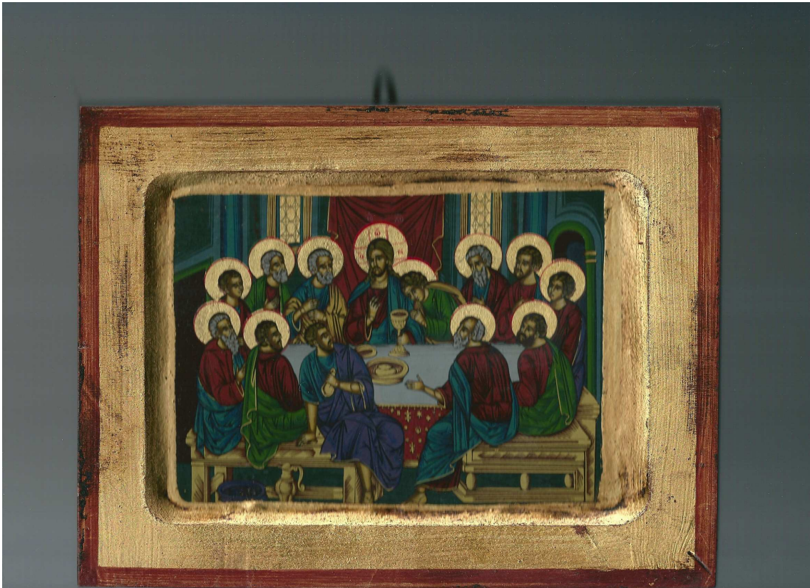
Misterio de Jesús: Icono número 10 (La última cena).