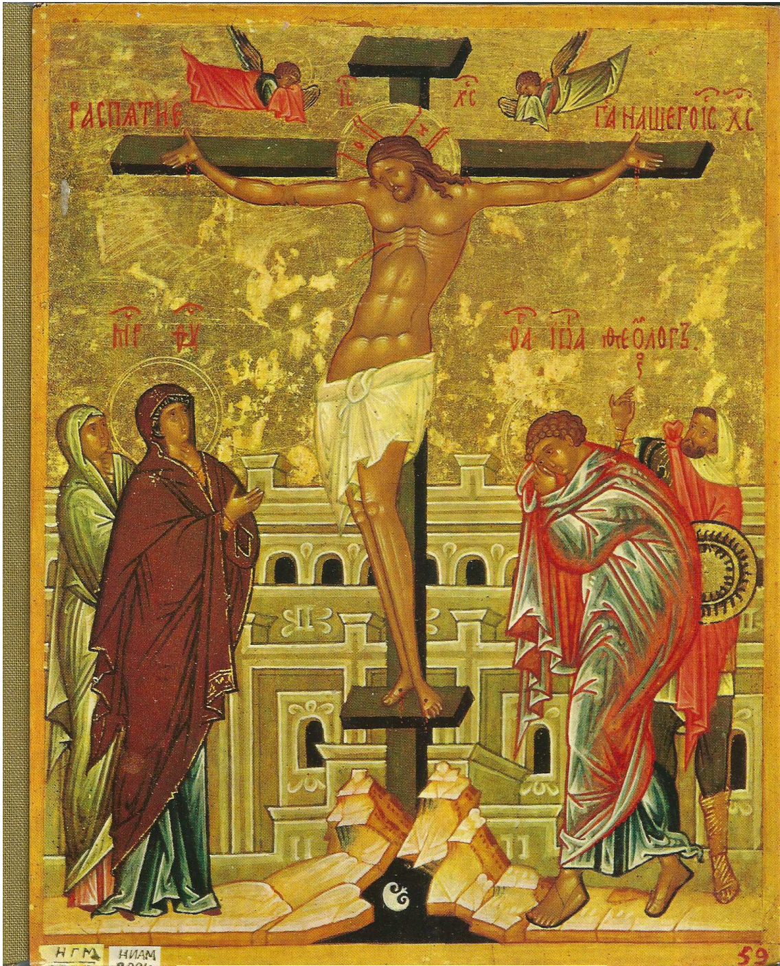
Misterio de Jesús: Icono número 16 (Crucifixión).